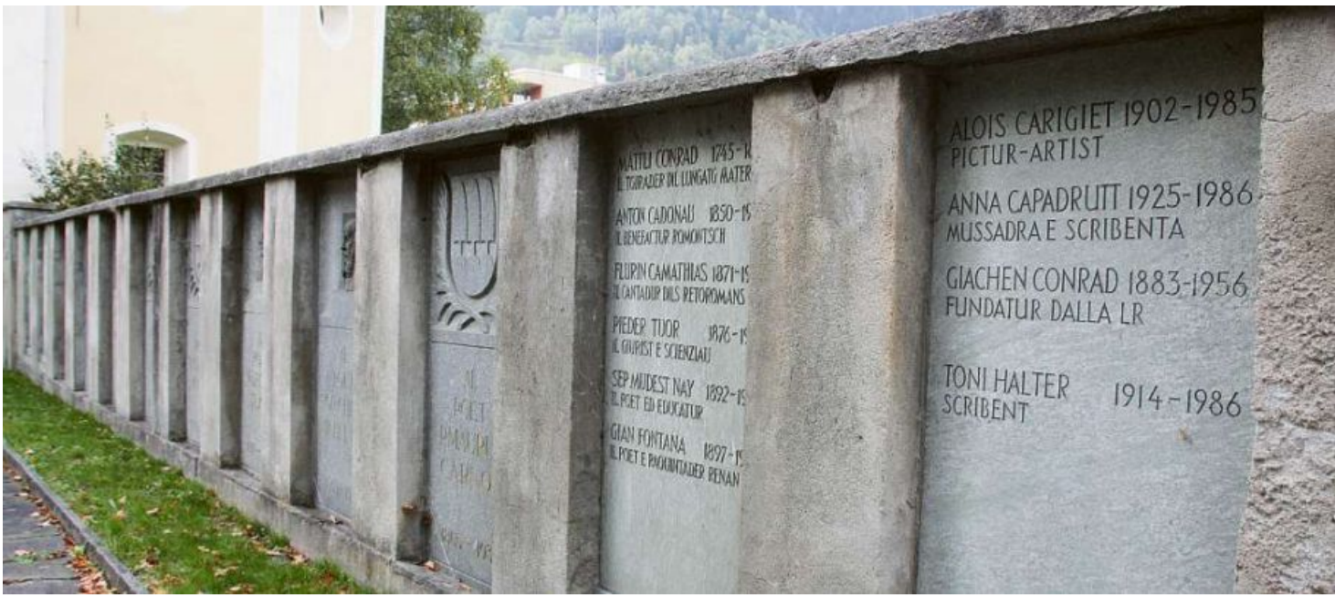
El Curtgin d'honor dalla Ligia Grischa a Trun undrescha la Surselva Romontscha igl onn proxim sis ulteriuras personalitads ch'ein sefatgas meriteivlas per la cultura romontscha.